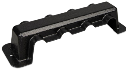
Abdeckung für Sammelschiene 250 A mit 4 Klemmen