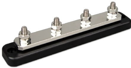
Sammelschiene 250 A mit 4 Anschlüssen ohne Abdeckung