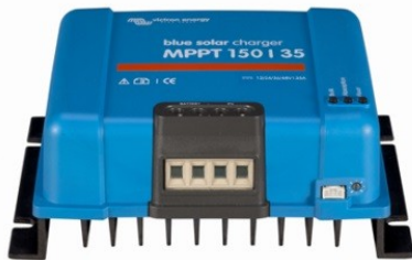
Regulator de încărcare solară MPPT 150/35