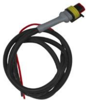
Steuerkabel für Cyrix-ct 12/24-230 Länge: 1 m