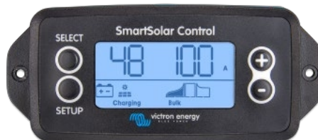
Ecran conectabil SmartSolar

Opțional: ecran LCD conectabil SmartSolar Pur și simplu îndepărtați garnitura de cauciuc care protejează mufa din partea frontală a controlerului și conectați afișajul.