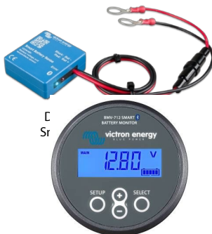
Senzor Bluetooth: Monitor inteligent de baterie BMV-712