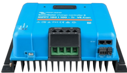
Regulator de încărcare SmartSolar MPPT 150/100-Tr VE.Can fără afișaj