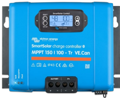
Regulator de încărcare SmartSolar MPPT 150/100-Tr VE.Can cu afișaj conectabil opțional