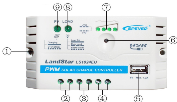
Obrázok 1. Vlastnosti produktu