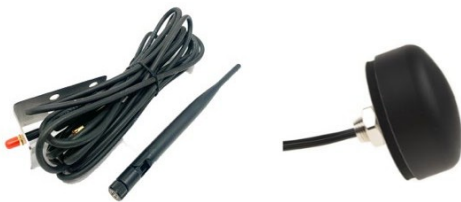
Optionale LTE-M-Außenantenne zur Wandmontage (ANT100200100)